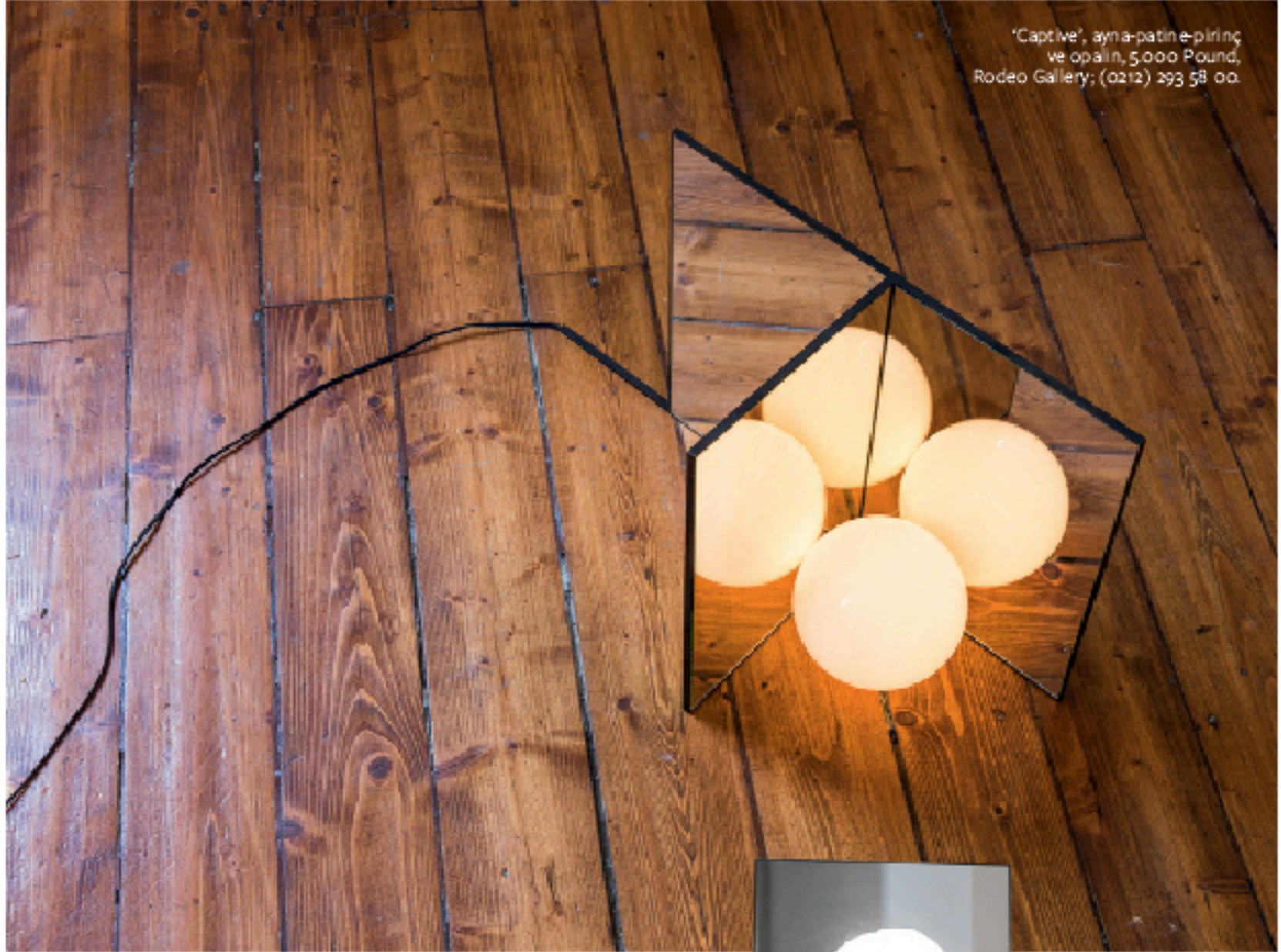
'Captive', ayna-patine-pirinç ve opalın, 5.000 Pound, Rodeo Gallery; (0212) 293 58 00.