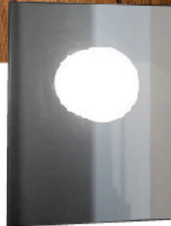
'Plunger' ayna, patine-pirinç ve opalinden, 5.000 Pound, Rodeo Gallery; (0212) 293 58 00.